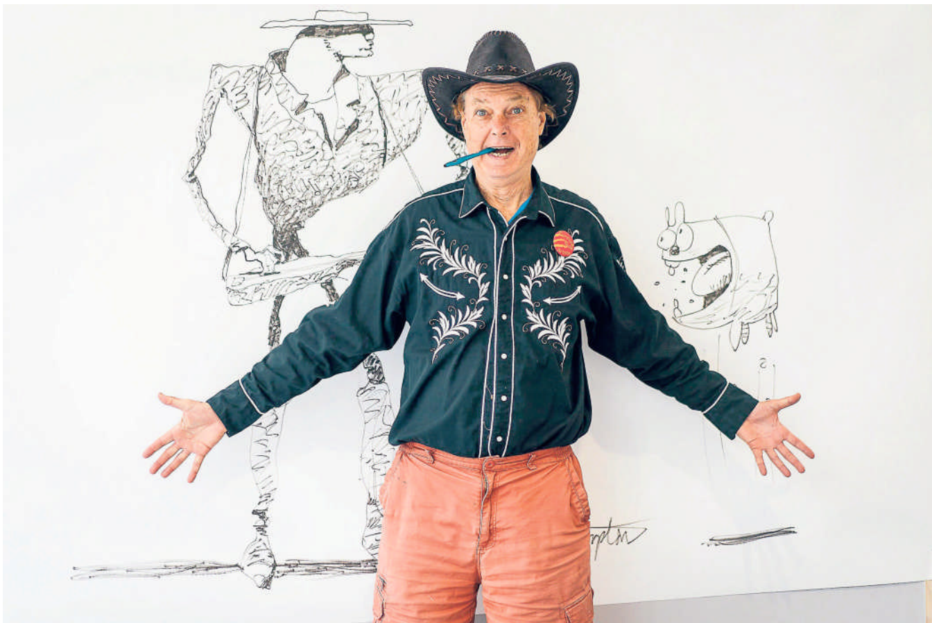
Le dessinateur et réalisateur Bill Plympton, en septembre 2024.