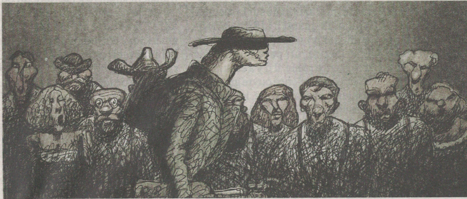
On retrouve les traits anguleux et frénétiques de Plympton.

B ill Plympton, vieux cow-boy de l'animation indépendante au palmarès long comme le bras (dix longs, une cinquantaine de courts et une myriade